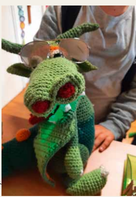
Bei den Schulworkshops oft dabei: Drako, der Kinderrechte-Drache.

Zwei Jahre Pandemie haben Spuren hinterlassen – vor allem bei Kindern und Jugendlichen, wie zahlreiche Studien belegen. Deshalb braucht es nun den Raum, um über Erlebtes sprechen zu können – auch in der Schule. Lehrkräfte, Sozialpädagoginnen und Sozialpädagogen sowie Schulpsychologinnen und Schulpsychologen spielen dabei eine wichtige Rolle. Ergänzend dazu ermöglichen es die Schulworkshops der Kinder- und Jugendanwaltschaft (kija) Salzburg, Thematiken, die aufgetaucht sind, tiefergehend zu bearbeiten – wie etwa psychische Gesundheit, Mobbing oder Zusammenhalt in der Klasse. Die kija kommt dafür an die jeweilige Schule – in Akutsituationen sogar unabhängig von der Ampel-farbe –, bietet aber auch Online-Workshops an, zum